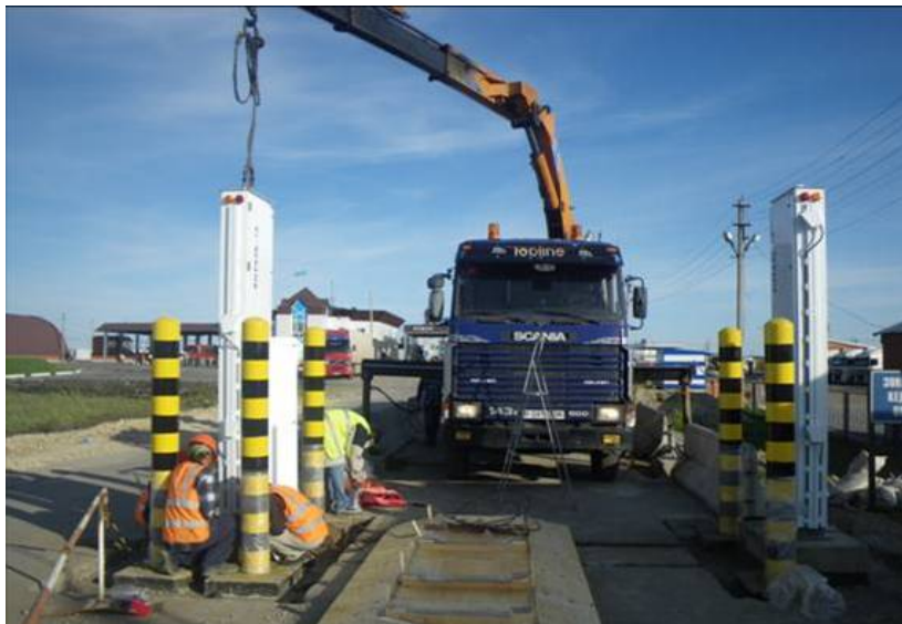
Byggingen av kjøretøysportaler ved grensestasjonen Kaerak i Kasakhstan..

Kampen mot nukleær og radiologisk terrorisme – at noen skal sprengre et kjernevåpen eller spre radioaktivt materiale som en «skitten bombe» som terrorhandling – er en av de mest alvorlige truslene mot internasjonal sikkerhet. Det globale initiativet for å hindre nukleær terrorisme er et norskstøttet initiativ som er direkte rettet mot bekjempelse av terrorisme fra ikke-statlige aktører. Strålevernet følger opp norske tiltak, blant annet i Kasakhstan, og verifiserer at de gjennomføres og fungerer etter hensikten.