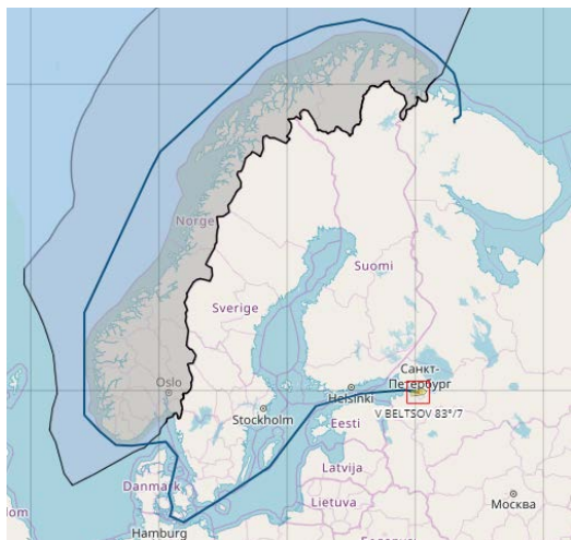
Planlagte rute fra St. Petersburg til Murmansk.

Scenarier med både brukt og ubrukt kjernebrensel om bord har vært aktuelle. Konstruktiv dialog mellom russiske og norske myndigheter har imidlertid ført fram, og kjernebrenselet skal fraktes til Murmansk med tog.