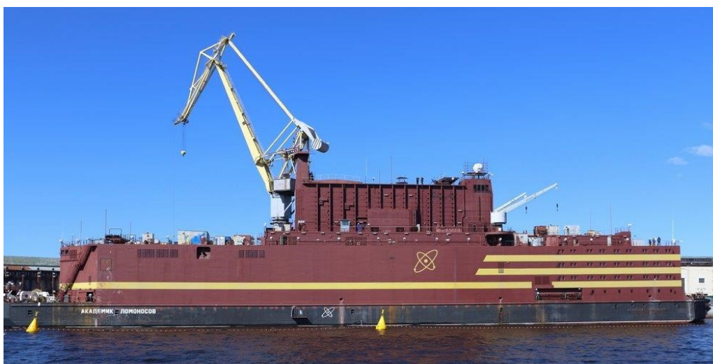
Akademik Lomonosov konstrueres hos verftet Baltic i St. Petersburg.

Våren 2018 skal et flytende, russisk kjernekraftverk uten kjernebrensel om bord transporteres fra St. Petersburg til Murmansk. Der skal reaktorene fylles med brensel og testes før kraftverket fraktes videre til sitt bestemmelsessted i Pevek. Kystverket og Statens strålevern er i dialog med russiske myndigheter og vil følge transporten langs kysten.