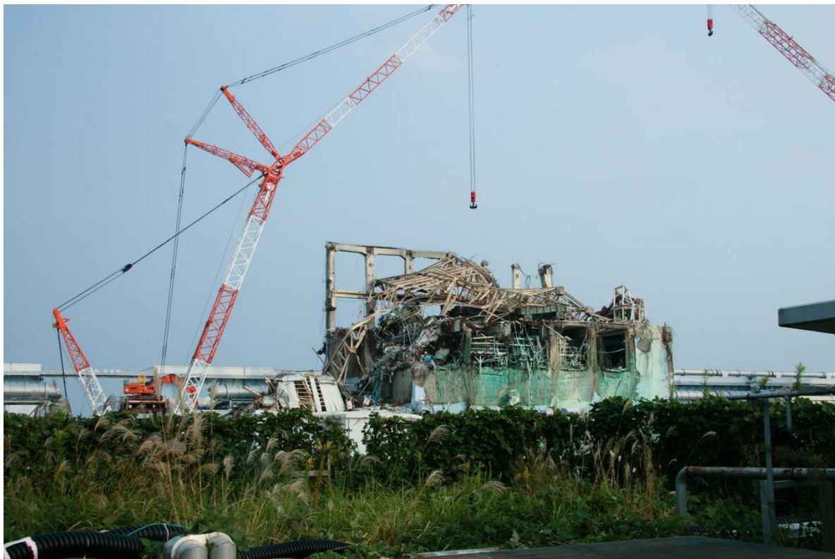
Kjernekraftverket Fukushima Dai-ichi. Et eksempel på en hendelse ved kjernekraftanlegg i utlandet som ikke berører norsk territorium.

Norske statsborgere og interesser kan bli berørt av bruk av kjernevåpen i utlandet.