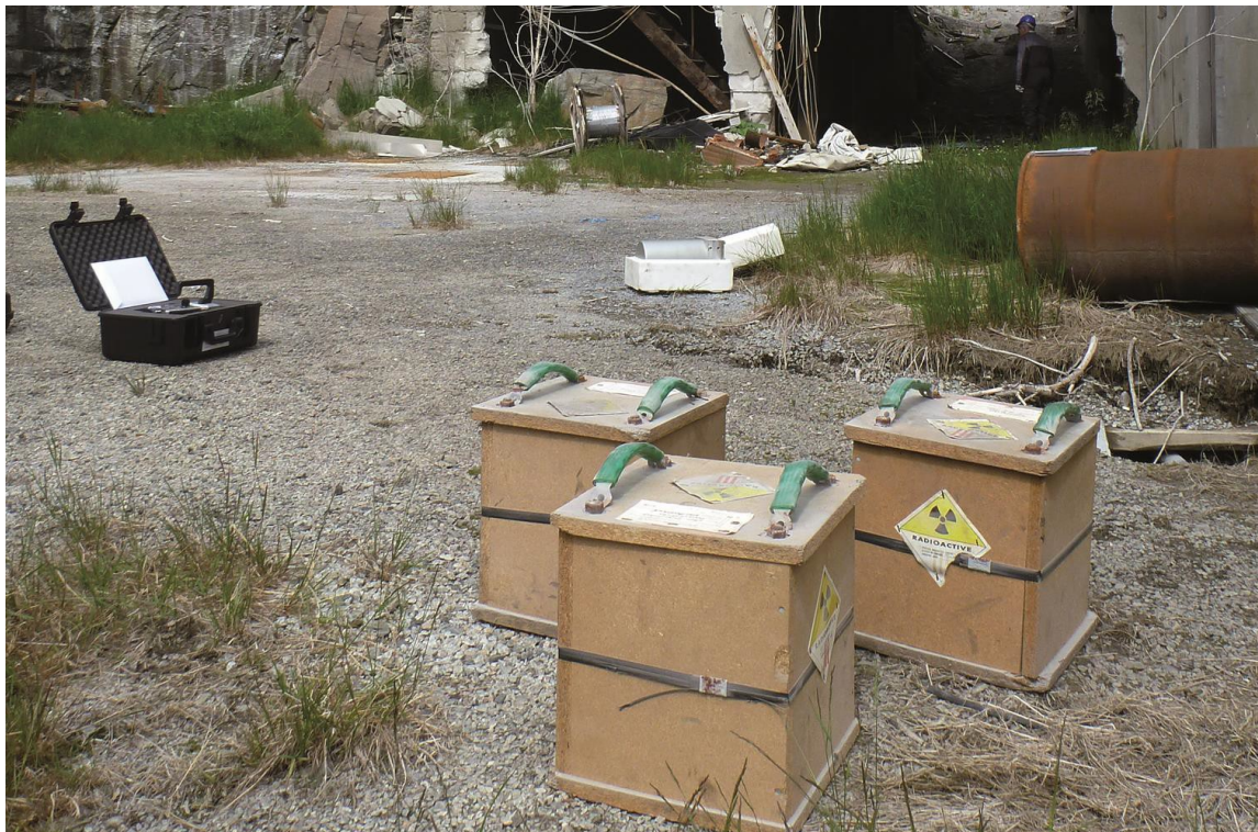
Strålekilder på avveier er ett eksempel på en hendelse i scenario 4.

Eksempler er langvarige utslipp fra kjernekraftanlegg eller andre anlegg for behandling eller lagring av radioaktivt materiale, strålekilder på avveier eller bruk av radioaktivt materiale i terrorøymed. Noen tidligere eksempler er strålekilde på avveier i Goiânia i Brasil i 1987, strålekilder på avveier i Mayapuri i New Dehli i India i 2010 og forgiftningen av Alexander Litvinenko i London i 2006.