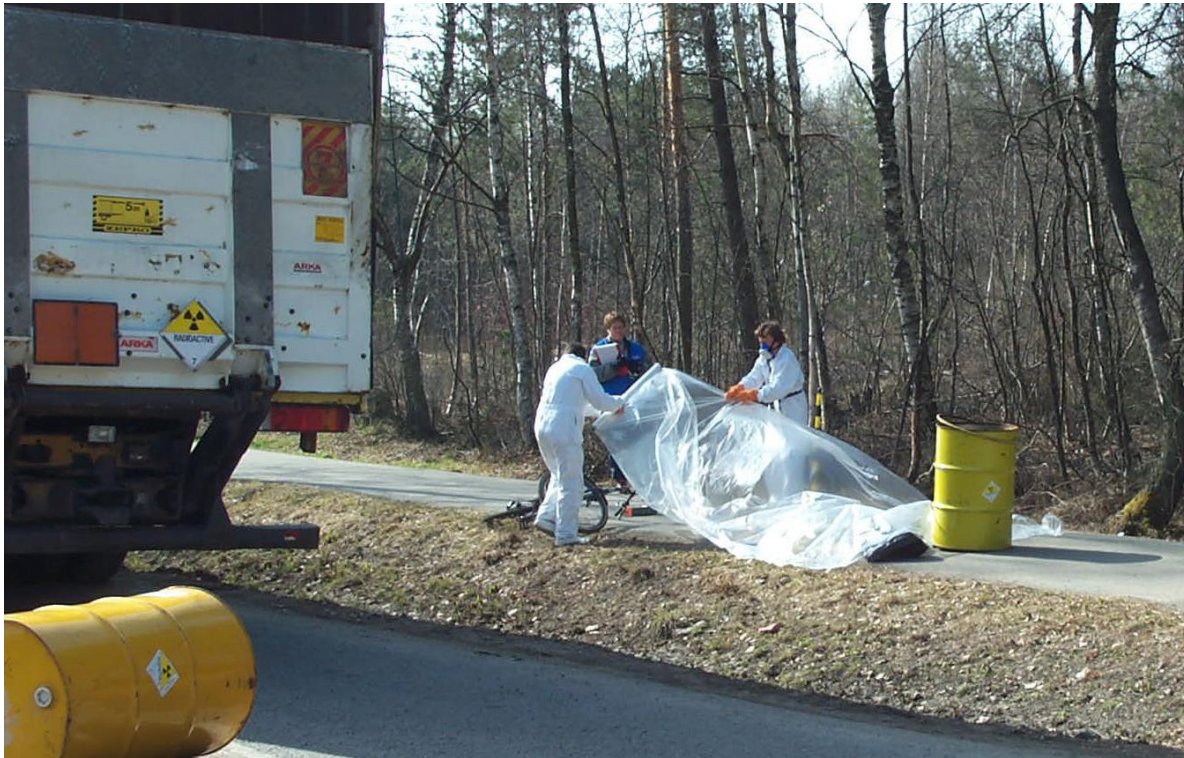
Ett eksempel på en hendelse i scenario 3 er uhell under transport av radioaktivt materiale langs vei.

Eksempler er hendelse med reaktordrevet fartøy eller transport av radioaktivt materiale et sted utenfor norskekysten med utslipp til luft. Andre eksempler er styrt av satellitt med radioaktivt materiale om bord, uhell under transport av radioaktivt materiale med fly eller langs vei, hendelser med strålekilder i bruk, strålekilder på avveier som dukker opp eller bruk av radioaktivt materiale i terrorøymed.