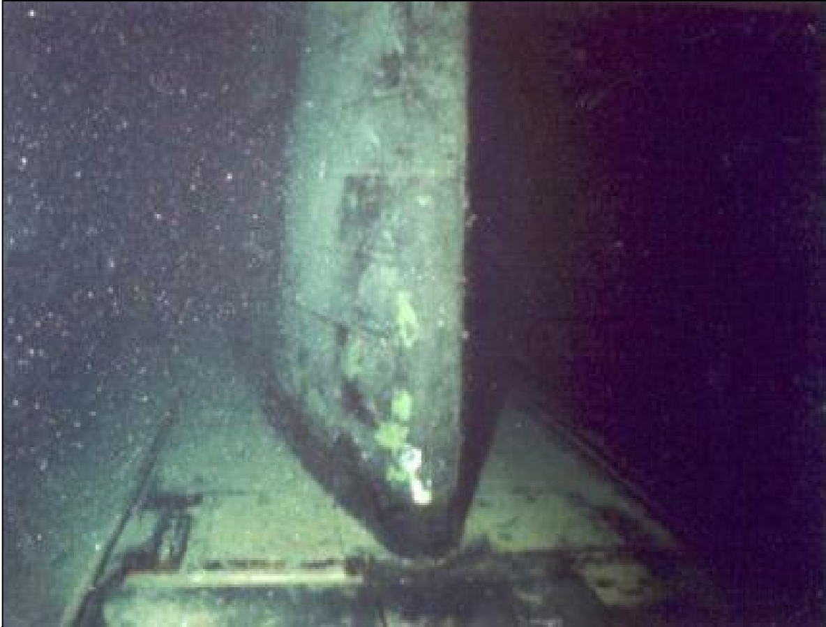
Den sunkne atomubåten Komsomolets er ett eksempel på en hendelse i scenario 5.

Eksempler er små utslipp til luft eller alvorlige utslipp til marint miljø fra reaktordrevne fartøy eller skipstransport av radioaktivt materiale i havområder i nærheten av Norge, eller lignende utslipp fra kjernekraftanlegg eller andre anlegg for behandling eller lagring av radioaktivt materiale. Noen tidligere tilfeller er forlisene av de russiske reaktordrevne ubåtene Komsomolets i 1989, Kursk i 2000 og K-159 i 2003.