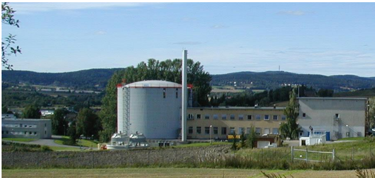
Forskningsreaktoren på Kjeller.

Eksempler på slike hendelser kan være ulykker/hendelser på en reaktordrevet ubåt som ligger til havn i Norge, eller ved en av forskningsreaktorene på Kjeller eller i Halden.