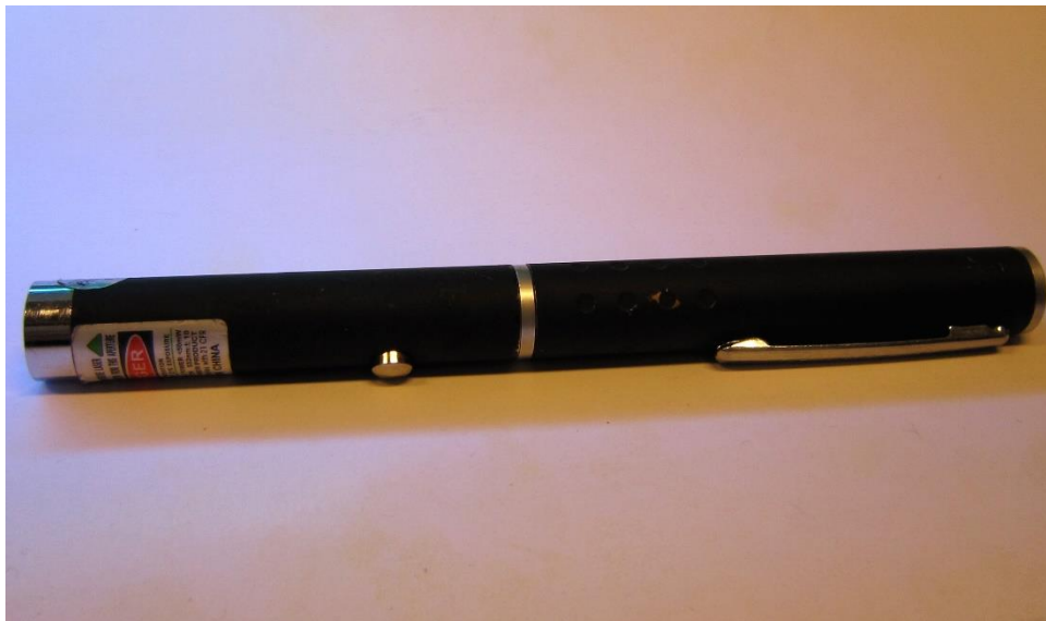
En laserpeker av klasse IIIb med typisk utforming og advarselsmerking etter amerikansk standard.

Direktoratet for strålevern og atomsikkerhet ser at mange laserpekere på markedet er merket og klassifisert etter amerikansk regelverk med klasse IIIa, IIIb og IV i stedet for 3R, 3B og 4. Dersom du kjøper en ny laserpeker med denne merkingen, vil du ikke få godkjenning fra DSA siden den ikke er i samsvar med NEK EN 60825-1.