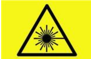
Symbol for laserstråling

Strålevernforskriften § 10 stiller krav til dokumentasjon som viser at laserpekeren er i samsvar med NEK EN 60825-1. Dokumentasjonen må følge laserpekeren. Hvis ikke denne dokumentasjonen blir vedlagt, kan søknad om godkjenning bli avvist. Vedlagt dokumentasjon må vise klassifisering og merking for den konkrete laserpekeren det søkes godkjenning for, for eksempel i form av produktark eller lignende.