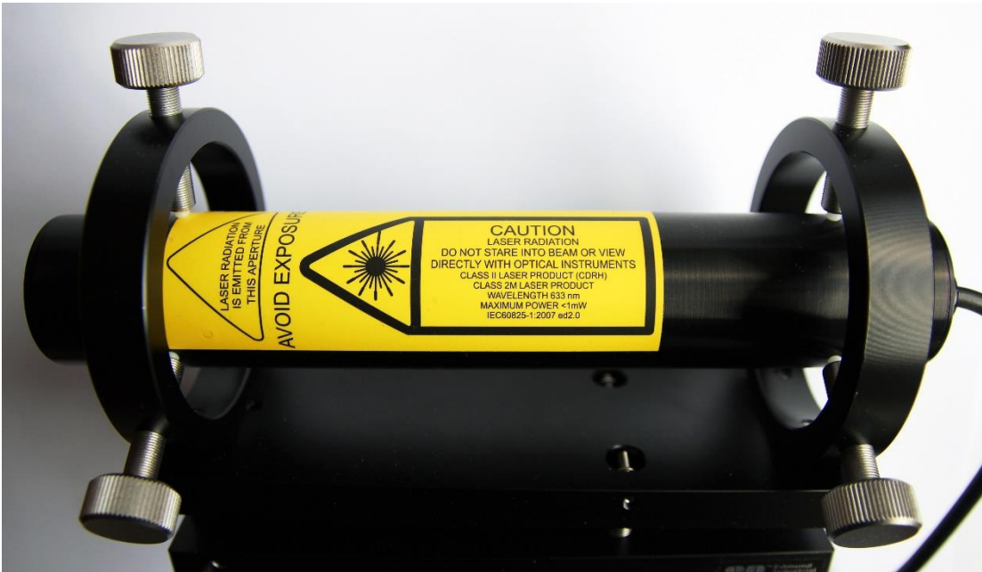
Laser klasse 2M merket etter NEK EN 60825-1.

Tekst og symboler som brukes ved merking av lasere, er gitt i laserstandarden NEK EN 60825-1. Bildet under viser eksempel på et laserinstrument med korrekt merking etter NEK EN 60825-1. I tillegg vises eksempler på alternativ merking etter standarden.