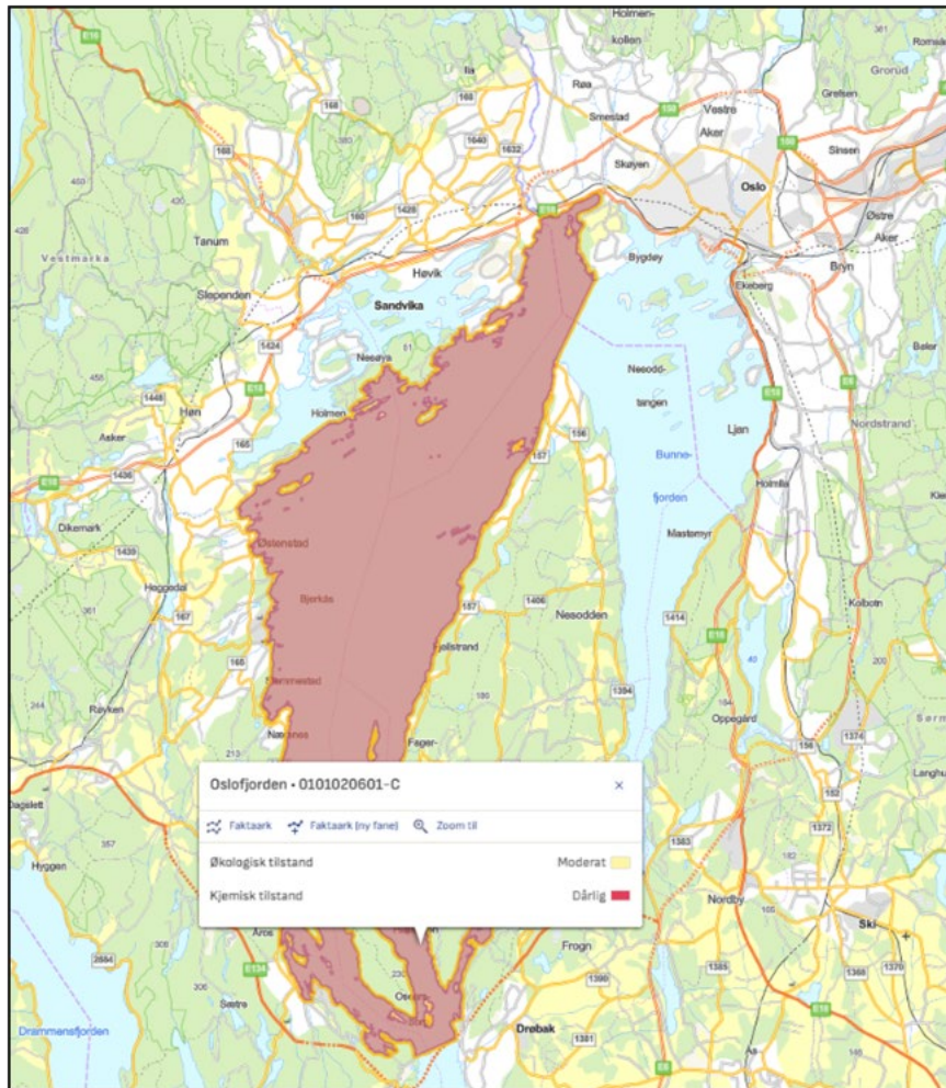
Figur 6.2 Oslofjorden er klassifisert med moderat økologisk tilstand og dårlig kjemisk tilstand.

Oslofjorden er klassifisert med moderat økologisk tilstand, men tilstanden er under sterkt press. Det er tre hovedårsaker til dette (3):